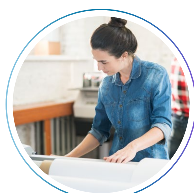
оператор в цифровую типографию