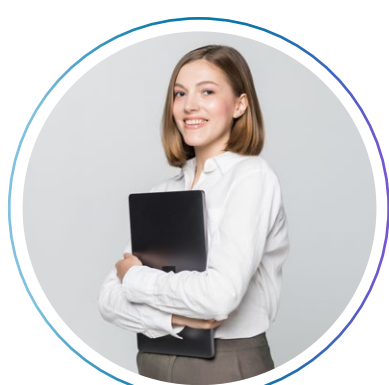
оператор базы данных